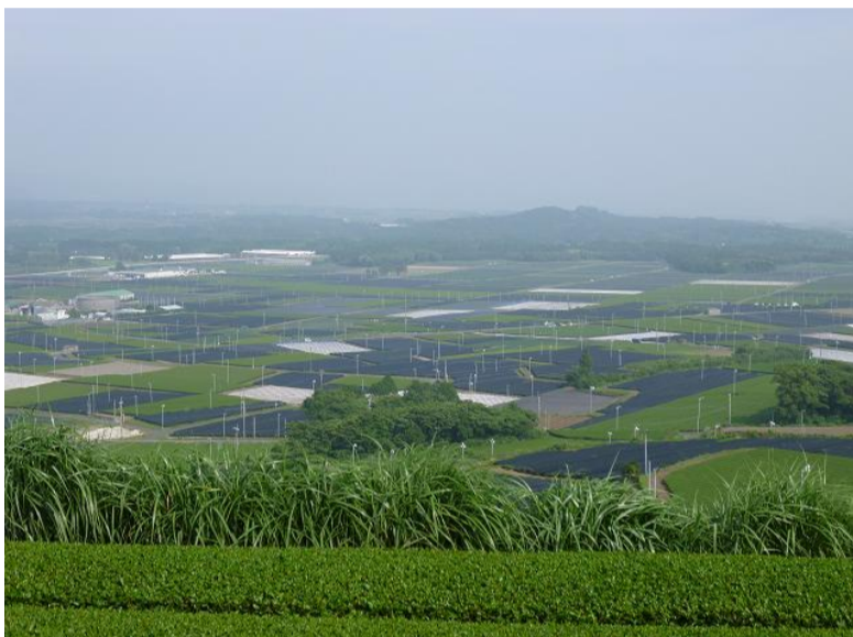
写真は鹿児島県知覧のお茶畑です。

でも日本人にお茶を飲んでもらうと、普段お茶を飲まない人にもおいしさがわかります。お茶の味がわかる人達なのに飲まないのは、魅力を十分に伝えてこなかったことを反省し、これから飲んでいただく環境を作っていくことが必要になっていきます。お茶をいろいろな視点から取り上げてお茶の魅力を伝えていく方法の1つとして、この「ひしわ園通信」を作ることになりました。